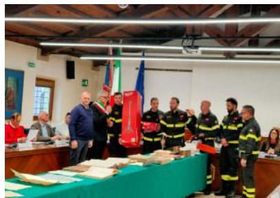
Cerimonia La consegna del materiale in sala civica