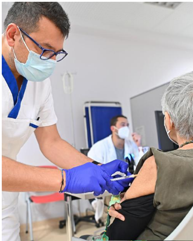
Una vaccinazione La prevenzione resta una delle armi migliori per battere l'influenza

L'Ulss 9 Scaligera, sul sito online, ricorda che la vaccinazione antinfluenzale è raccomandata e offerta gratuitamente a: over 60; bambini dai 6 mesi ai 6 anni compresi; cittadini con patologie che aumentano il rischio di complicanze da influenza; donne in gravidanza e nel post-partum; familiari e contatti di persone ad alto rischio di complicanze legate all'influenza; addetti a servizi pubblici di interesse collettivo (operatori sanitari, insegnanti, forze dell'ordine); donatori di sangue. Si fa dal medico di famiglia, dal pediatra